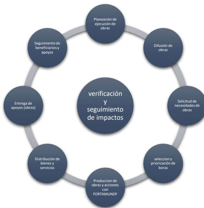
FIGURA 1. MODELO GENERAL DE PROCESOS SEGUIDOS

En consecuencia a lo anterior, el grado de consolidación operativa del FORTAMUNDF, permite reconocer que 1) no existen documentos que normen los procesos del FORTAMUNDF; 2) los operadores de los procesos están documentados respecto a la aplicabilidad del FORTAMUNDF en obras; 3) los procesos están estandarizados respecto a la planeación de obras; 4) se cuenta con un sistema de monitoreo e indicadores de gestión que retroalimenten los procesos operativos por medio de sistemas de información aplicativos; 5) No se cuenta con mecanismos para la implementación sistemática de mejoras. Por lo anterior, consolidación operativa del FORTAMUNDF es de menor alcance comparado con el FORTAMUNDF como otra fuente de financiamiento de obras para el Municipio.